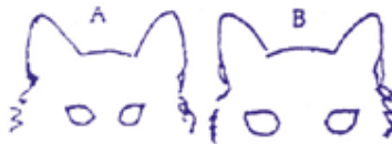
Рис. 8. Постав глаз